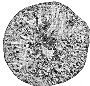
Snitt av u-impregnert kaipel etter 6 måneders bruk i sjø vann.

— Disse noteringer er å forstå pr. 1016 kg., netto cif. regulære havner, losset bruttovekt (original tara i drums) netto kontant mot dokumenter ved skibets ankomst.