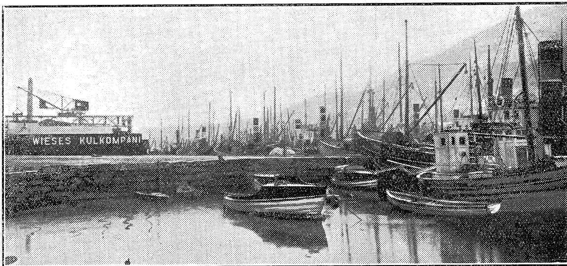
Fiskedampere ferdigbunkret i Bergen hos Wieses natt til søndag og klar å gå tilsjø mandag morgen. I bakgrunnen sees Wieses Kulkompanis stasjon Møhlenpriskaien. (Avert.)

Hamburg. — Fiskeriagenten 7/2: Fra Norge ankom i ukens løp 10 069/1 og 799/2 sekker. — Fra Storbritannia ankom 4022 sekker, fra Amerika 920 sekker og 500 sekker fra Island. — Noteringene, som er uforandret, er (£): Norsk torskemel 20-0-0, vestlandsk sildemel op til 8 pct. salt 13-10-0 og nordlandsk sildemel 14-10-0 pr. tonn (1000 kg.) cif. Hamburg.