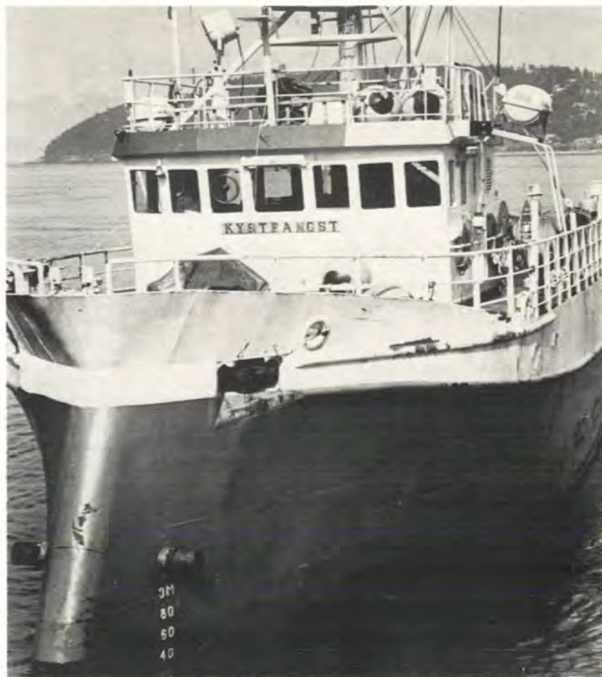
Ombygging av baugen vil gi betydelige sparemuligheter. Dette er bevist med FTFI's eget forskningsfartøy Kystfangst.

– Nyere norske fiskefartøyer har for store motorer.