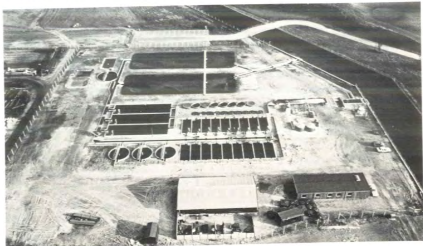
Dansk Akvakultur Instituttets 70 tonn kjølevann/saltvannsdambruk i Sønderjylland.

Instituttet beskjeftiger 16 medarbeidere, herav ni biologer. Omsetningen er på ca. 10 millioner kroner, hvor ca. 75 % kommer fra konsulentopp-gaver.