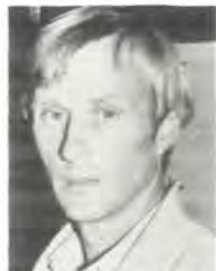
Håkon Selbervik A.S. Hydraulik Brattvåg

– Alle som har vært innom har spurt etter det nye ekkoloddet vårt. Det er også stor kjøpeinteresse. Mange teller på knappene, og noen har allerede bestilt. Særlig er vi fornøyd med kontrakter til utlandet. En av verdens største trålere, nemlig Artic Trawler, har kjøpt ES 380, det samme har islendinger og færøyinger. Vi hadde faktisk også med oss verdensnyheten SX 570 som er en ny sonar, hit til messen. Den er liksom kommet litt vekk i all oppstusset omkring det nye fiskeletingsutstyret vårt. Vi skal likevel ikke klage, det har vært en suksessmesse for Simrad.