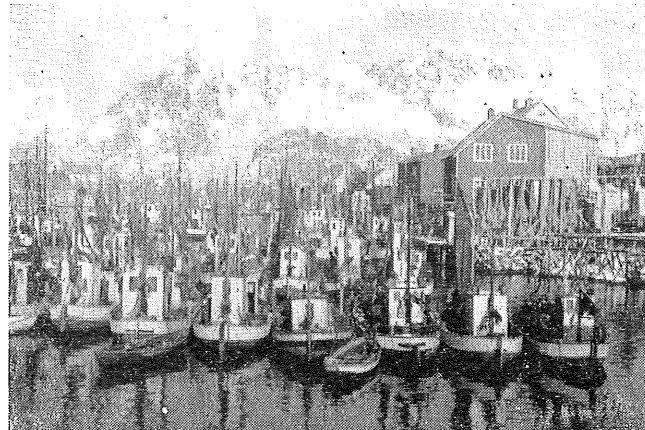
Fra Henningsvær i travleste sesongen.

store mengder lodde i lås og fisken er fullproppet både der og i Magerøydistriktet. Den tar derfor bare dårlig på line. Fisket beskrives som meget ujevnt og dårlig i somme distrikter. I ukens løp er det i fylket blitt oppfisket 1595 tonn fisk mot 1360 tonn uken før. Av partiet nevnes 1031 tonn torsk, 452 tonn hyse, 4,6 tonn sei, 25,4 tonn brosme, 36,4 tonn kveite, 25,4 tonn flyndre, 8,8 tonn steinbit, 8,6 tonn uer. Kveitepartiet er som det vil ses ganske betydelig, men så har også en del fiskere lagt om til kveitevad.