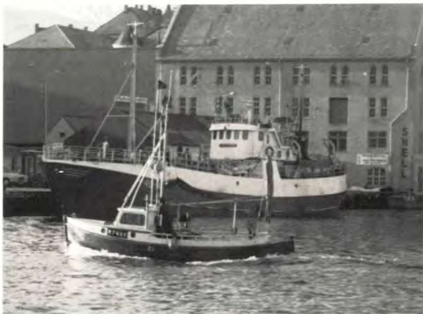
«KARL VADØY» er nå døpt om til «KARL MAGNUS» etter eierskiftet.