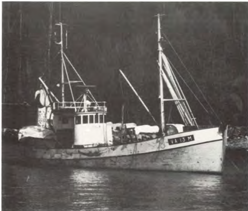
Trebåten «ROGUN» er nå strøket av Skipsmatrikkelen.