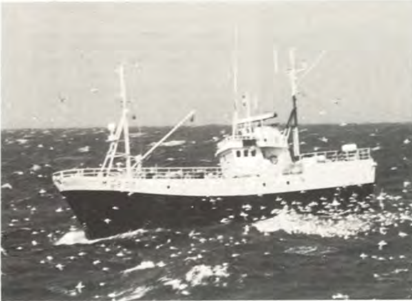
Molde-båten M-88-SØ «VONAR» ble i februar forlenget til 26,26 m.