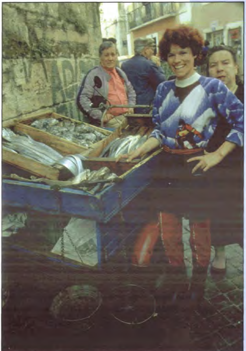
Det er ikkje lenger grense for kor mykje forteneste oppkjøparane kan ta. Fiskarar som har fått 50 escudos (25 øre) kiloen på fiskemottaket, kan finna han att på marknaden til 600–800 escudos pr. kilo.