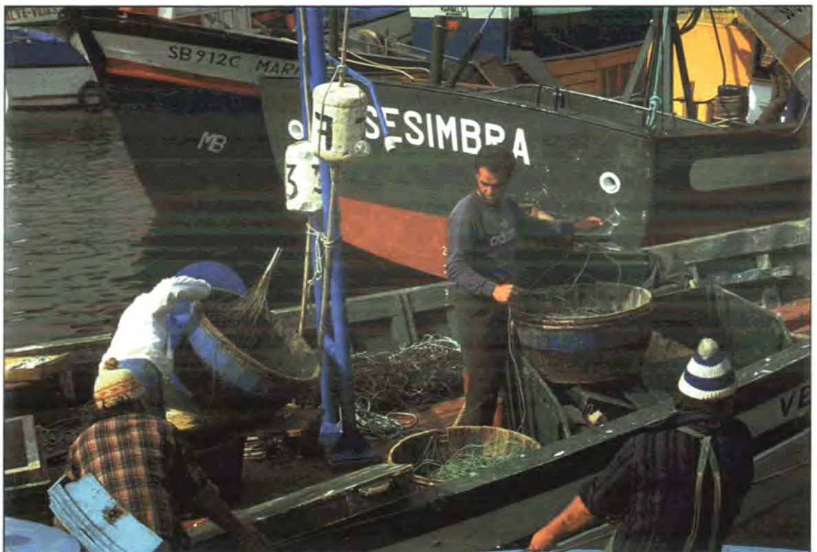
Uoversiktelege tilhøve i det tradisjonelle kystfisket gjer det vanskeleg å få oversikt over kor mange fiskarar som er arbeidslause.

– Eg snakka nyleg med både reiarar og mannskap i Mathosinhos, der fleire sardinbåtar vart hogd opp i fjor. Dei fortalde at det ikkje var vanskeleg å få arbeid, tvert imot, fleire båtar låg ved kai fordi dei ikkje får fatt i fiskarar, seier ei optimis-