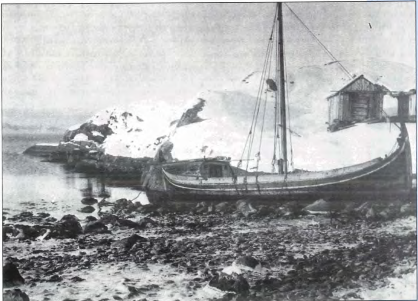
Fembøringen ble ofte benyttet av nordfarerne til juksafisket i Finnmark

Rathke var visjonær med en langsiktig strategi. Dessverre ble bare noen av hans gode råd fulgt. De tema han tok opp, har kanskje derfor ofte like stor aktualitet i dag som dengang.