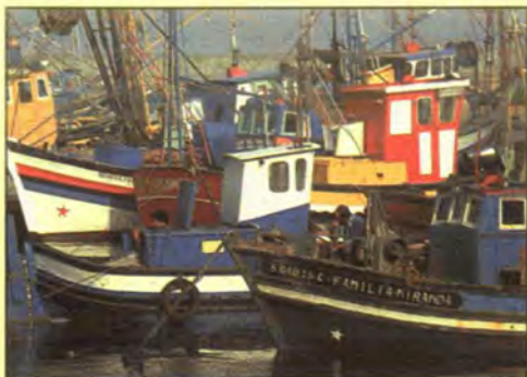
Krise eller berre problem? Den fargerike portugisiske flåten har vorte 30 prosent mindre enn i 1986.

«Krise», seier fiskebåteigarar og fiskarar FISKETS GANG har snakka med om situasjonen. «Ikkje krise, berre visse problem», seier fiskeridirektøren, som meiner naudsynt fiskeripolitikk i 90-åra er å ligge eit hestehovud føre EU-sitt direktiv om opphogging av fiskeflåten.