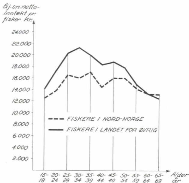
Fig. 2. Gjennomsnittlig nettoinntekt for fiskere i ulike aldersgrupper 1968. Nord-Norge og riket for øvrig.

snittsinntekt enn byrkesfiskerne, mens forholdet vekslet fra aldersgruppe til aldersgruppe i de mellomliggende grupper.