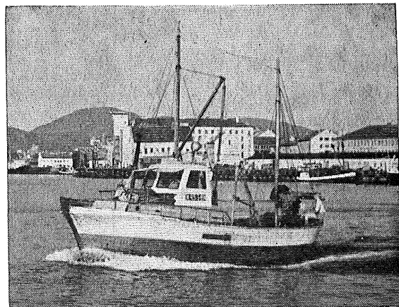
32' sjark med HB3M.

Andre typer: Ferskvannskjølte 24–1600 HK.