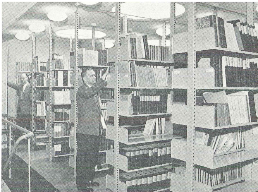
Biblioteket, fra et av bokmagasinene