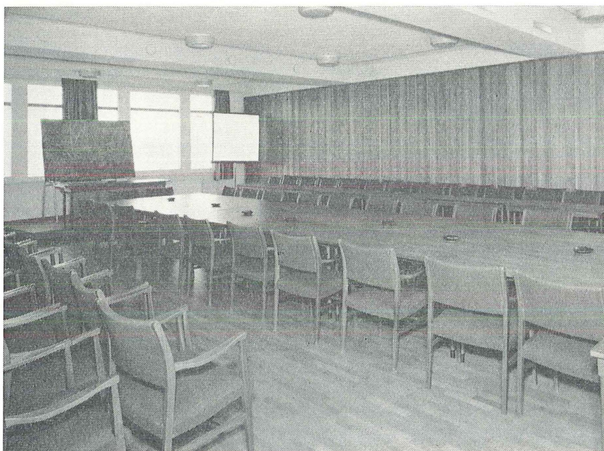
Foredragssal, tiende etasje