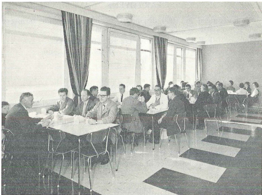
Kantinen, tiende etasje

laboratoriene, og i tiende etasje er det kantine, møtesal og tekniske rom. Alle de øvrige etasjer anvendes som kontorer, delvis kombinert med laboratorier, hvor der bl. a. er opplegg for sjøvann.