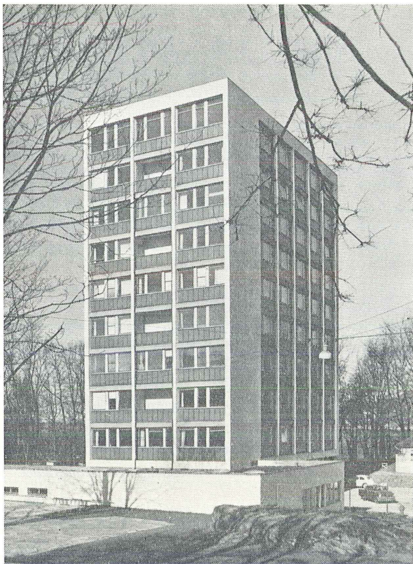
Instituttet sett fra sydøst

Nede ved sjøen ligger pumpehuset, som forsyner akvariet og instituttet med sjøvann. Et nødaggregat er plasert i et eget hus. Havforskningsinstituttet har en samlet gulvflate på 4700 m 2 , medregnet kjelleren. I kjelleretasjen er der fyrrom, transformatorrom, tilfluktsrom, bokmagasin og vannreservoarer for hele anlegget. Instituttet har tre lagerrom her, og en del av korridorene blir også disponert til lagring av vannkasser etc. Dessuten disponerer instituttet over stimkummen i akvariets underkjeller, hvor også mesteparten av det tekniske utstyr befinner seg. I de øvrige etasjer har instituttet i alt 81 rom på tilsammen 1452 m 2 . Av dette disponerer fartøyenes befal to rom, verkstedsleder, vaktmester og annet personale tre rom, pensjonister ved instituttet ett rom og akvariet fire rom.