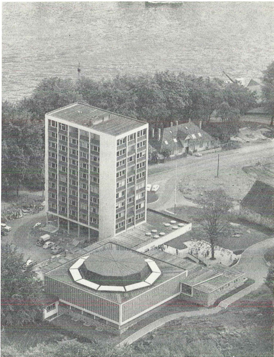
Luftfoto av instituttet og akvariet sett fra vest

kludertes med forslag om reising av et samlet anlegg for Fiskeridirektoratet på Nordnes, og at et tilbud fra Akvariekomiteen om reising av et akvarium i tilknytning til Fiskeridirektoratets Havforskningsinstituttet ble akseptert. Det hele anlegg ble foreslått reist etappevis med Havforskningsinstituttet og Akvariet som første etappe.