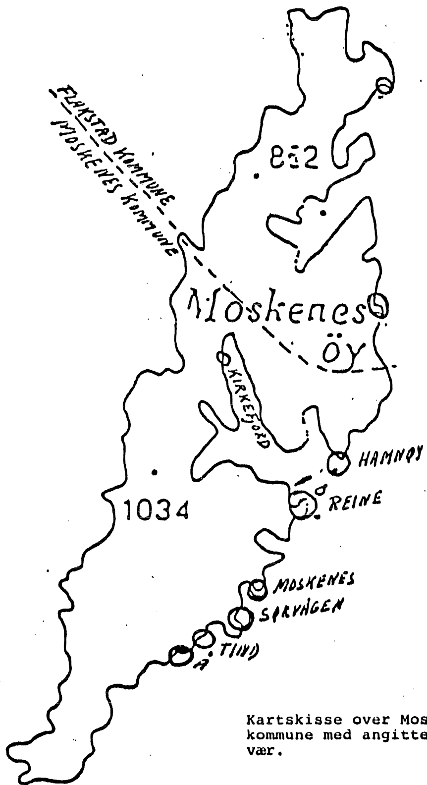
Kartskisse over Moskenes kommune med angitte fiskevær.