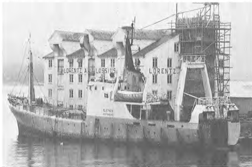
Saltfisktråleren «Sletnes» var også venta inn til Kristiansund før jul. Båten var på hjemtur fra Svalbard/Bjørnøya med ca. 200 tonn saltfisk, blir det meldt.

I Vesterålen leverte 6 trålere fangster fra 17—107 tonn, og i Lo-