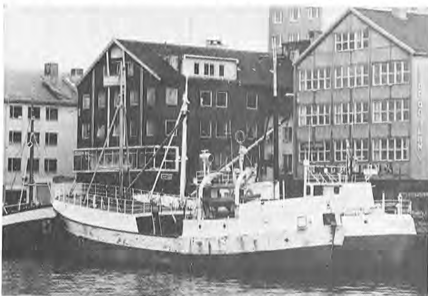
«Vågen Senior» var venta inntil Kristiansund like før jul med ca. 40 tonn saltfisk og 10 tonn frossenfisk. Banklinebåten hadde fiska på Tromsøflaket sammen med flere andre møre-båter.

Sørvær: 1 trålfangst 34 tonn, linefangster på 100 kg pr. stamp i gjen-