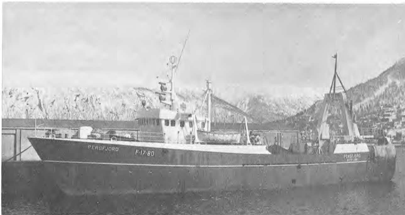
Heller ikke på siste tur før jul, blei det storfangster for ferskfisk-trålerne, sett under ett. Men enkelte båter gjorde det skarpt. Best var «Hekktind» med 107 tonn, og «Nord Rollnes» med 95. Fotoet viser «Persfjord» som representerte gjennomsnittet med ca. 46 tonn.

foten leverte 6 trålere fangster fra 28—64 tonn. «Hekktind» leverte den største fangsten i Vesterålen, og «Lofotrål I» den største i Lofoten.