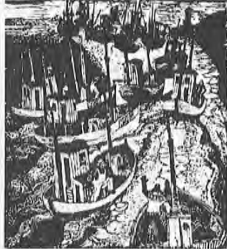
Utgitt av Nordland Fylkes Fiskarlag

Fiskerihistorie for Nordland Eivind Thorsvik