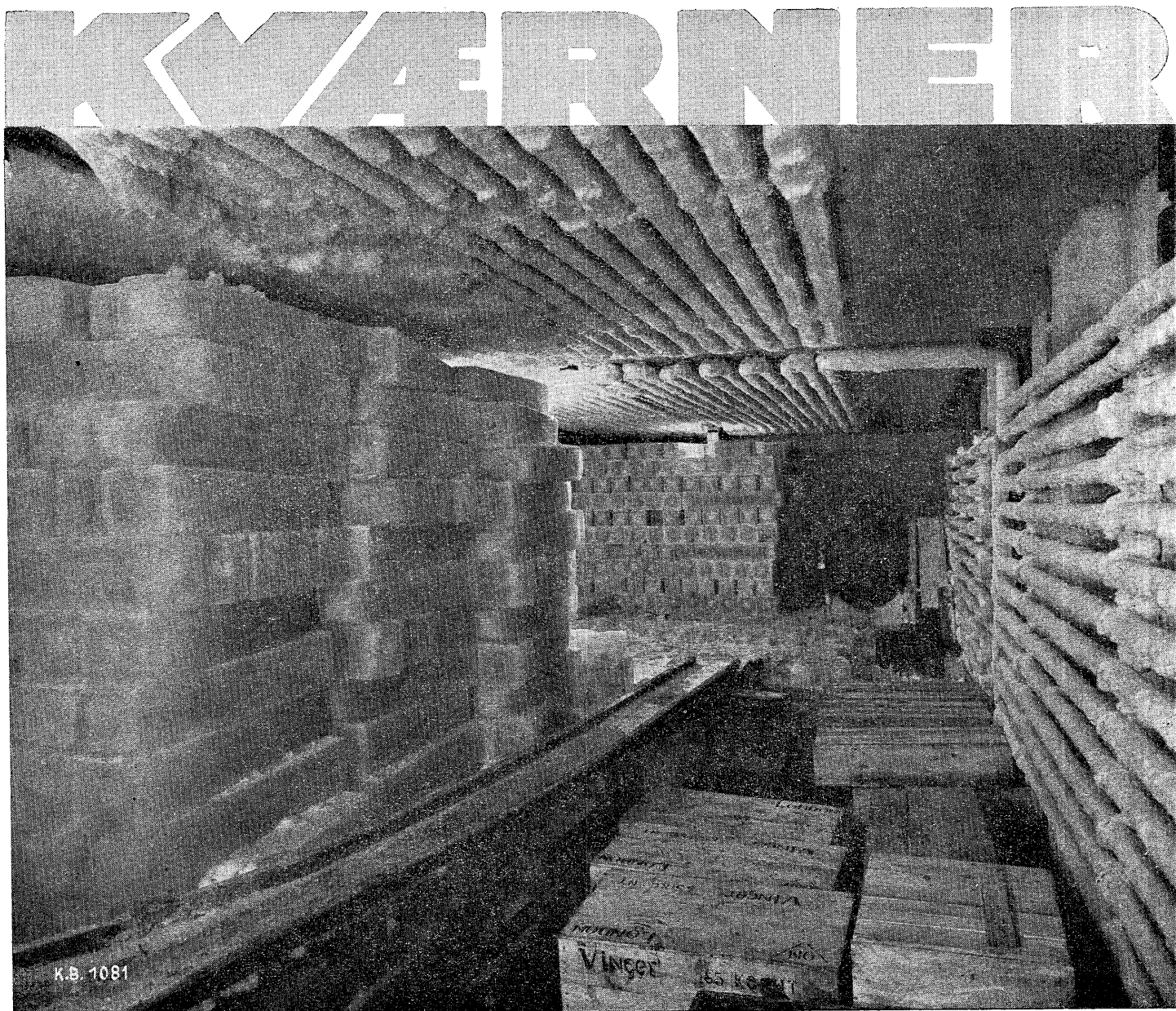
Islager for Romsdals Kjølager, Molde.

Til ROMSDALS KJØLELAGER leverte vi maskiner for frysing av 22000 kg is, 600 kasser sild, 3750 kg hvalkjøtt, alt pr. døgn. Kjøle- og fryserummenes størrelse 1040 m 3