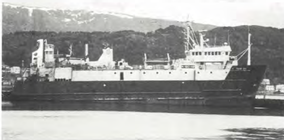
M-180-HØ «POLAR SEA»