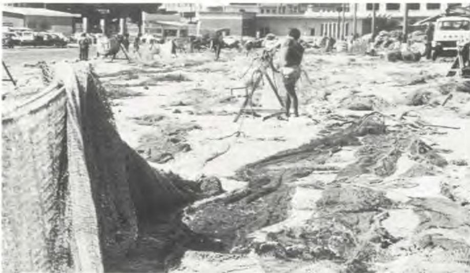
En oversikt over fiskernes fangst og redskaper, vil være et godt utgangspunkt for bedre kontroll av ressursgrunnlaget, mener Tovio. Her bøtes garn ved havnen i La Coruna.

– Hvis jeg kunne bestemme, ville jeg at alle i 1990 skulle oppgi fangst og størrelse på garnene. Fra 1991 ville jeg så foreslått en reduksjon på 10 prosent, gjennom en to-måneders fiskestopp. Da hadde vi hatt sammenligningsgrunnlag. I 1993 ville jeg utvidet fiskestoppen til tre måneder, og vise at fiskerne likevel tjente det samme som før. Så i 1994–95 ville vi sannsynligvis sett at bestandene hadde bygget seg opp. Jeg tror dette kan oppnås uten å skape arbeidsløshet og sosiale problemer. Staten, men også de som kan fortsette fiske og dermed nyte godt av begrensningene, må bidra.