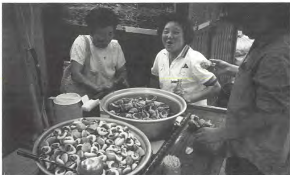
Snegler og skalldyr selges på markedet i Seoul, Korea.

Den 14. internasjonale ernæringskongress viste at denne kongress-serien er sjølv flaggskipet innan ernæringsforskninga. Med nærare 3000 deltakarar frå 89 nasjonar var det eit stort løft for det koreanske selskap for ernæring å stå som arrangør av møtet. Undertittelen for møtet, «New era. Global harmony through nutrition», viste òg at arrangørane har større ambisjonar med kongressen, enn dei reint faglege.