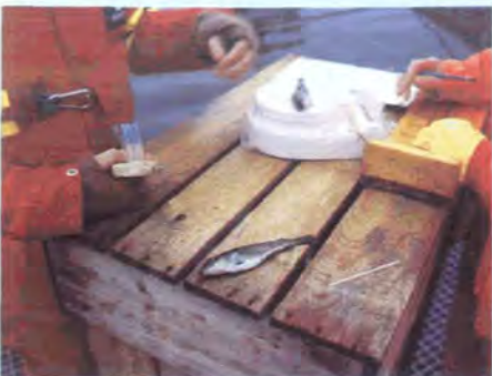
Fallnot (øverst) og Floy-merking av torsk.