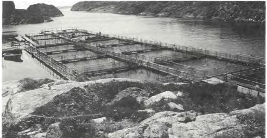
De fleste fylker har kraftig redusert kostnadene pr. kg. produsert fisk.

Tabellen nedenfor viser en del hovedresultater i gjennomsnitt pr. anlegg, basert på hele utvalgsmengden. Tilsvarende tall for 1986 og 1987 er tatt med for sammenligning.