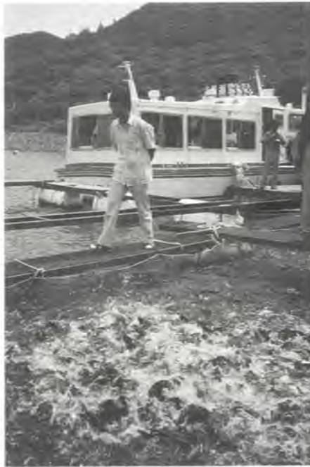
Oppdrett av israelsk karpe i innlandsdemning i Korea.

Korea har lange tradisjonar for risdyrking, og ris er for mange hovedenergikjelda. Ellers førte deira religiøse tradisjon med å prøva å vera i balanse med omgjevnadane til at også kosten er balansert, og store måltid er sett saman av mange smårettar som skal vera i balanse.