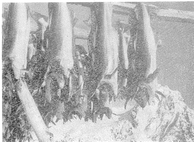
Tørrfisk på hjell.