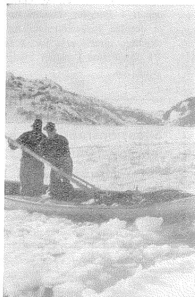
Nordre innløp til Egersund 9. februar

»Vintersildfisket« er en publikasjon i serien »Årsberetning vedk... gir her seks bilder som dokumenterer den usedvanlig kolde sesonger