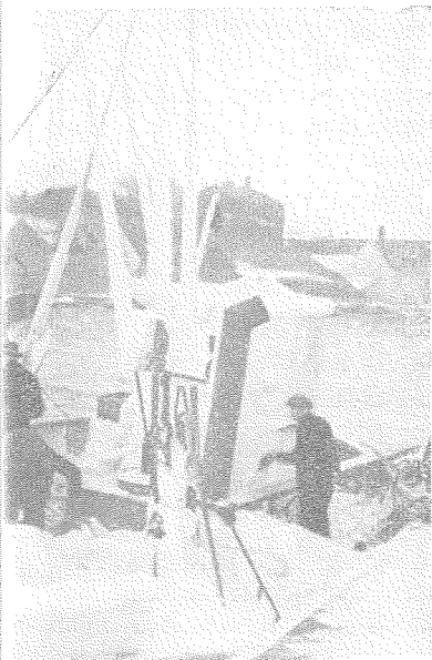
januar 1942. (Foto: S. Clausen, Haugesund).