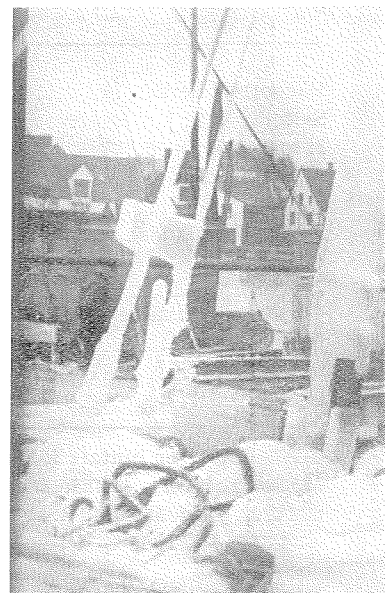
Drivgarnsfartøyer som var ute på feltet nå