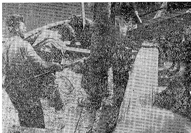
Innlasting av brising.