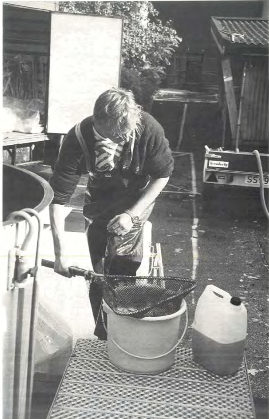
Vaksinerings av smolt.

Brit Hjeltnes ser på vaksine som et godt alternativ til antibiotika. Vaksinasjon gir ingen toksiske bivirkninger, ingen uønskede restkonsentrasjoner og ingen resistensutvikling. Bruk av antibiotika kan derimot føre til dannelse av mer resistente bakterier, f.eks i slammet under oppdrettsanlegg. Videre skaper antibiotika problem med restkonsentrasjoner i fisken, og gjentatte behandlinger er nødvendig. Vaksinasjon er en forebyggende behandlingsmetode, ikke en metode for akutt behandling, som tilfellet er med antibiotika.