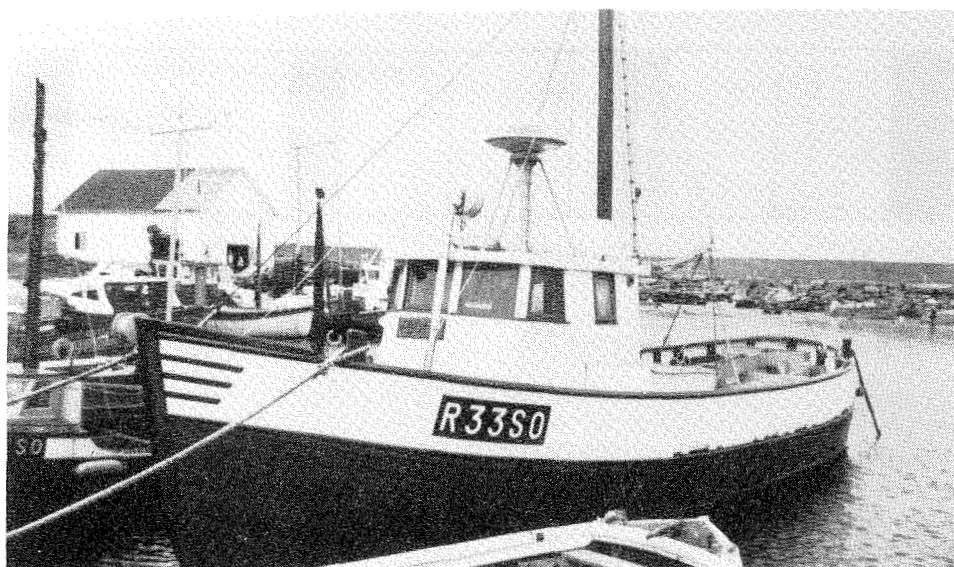
Fig. 3. Fiskefartøy med merke av 2. klasses størrelse.