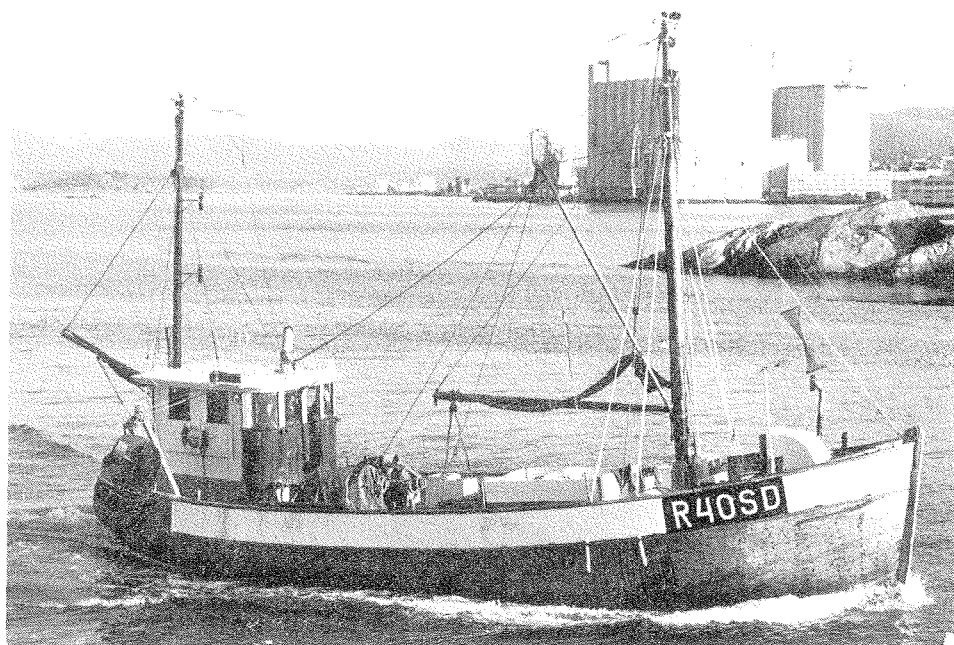
Fig. 2. Fiskefartøy med merke av 1. classes størrelse.

Etterstående figurer viser eksempler på hvordan merket anbringes.